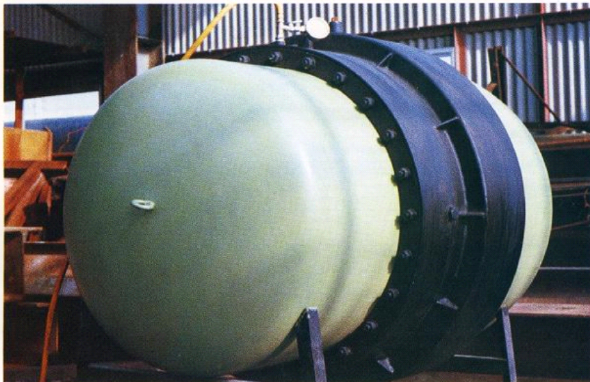
800A Y-2型 漏水圧20kg/cm 2